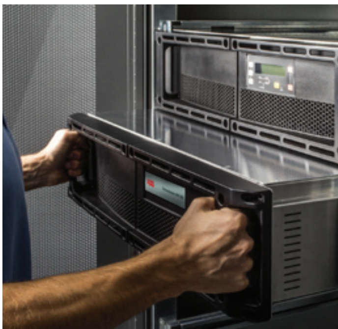
Модули «горячей» замены

Масштабируемость модульной архитектуры позволяет достичь значительного снижения потребления электроэнергии и выбросов CO 2 . Не только это, но и самый высокий в своем классе КПД до 96% обеспечивает заметное снижение эксплуатационных расходов системы и расходов на охлаждение. Но, что более важно, КПД оптимизирован для достижения плоской кривой эффективности, что дает значительную экономию в каждом рабочем режиме.